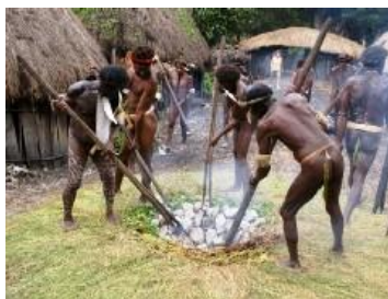
Een smoorkuil voor varkensvlees

kangoeroe stripte de huid van de boom en nam het hart eruit. Nadat hij dat had gedaan, ging Yeli naar de Kivier en de Tahirivier. Daar aangekomen, volgde zijn linkerarm – inggik - het spoor door de dorpen naar beneden. Deze arm wordt To genoemd. Zijn andere arm, genaamd Melime, nam het spoor door de dorpen aan de andere kant van het gebied. Zo kwam zijn lijf. Eerst stampde hij op de aarde in Masamlu. Toen boorde hij zich door de Pasin berg. Vervolgens liet hij de Inalik waterval naar beneden vallen. Vandaar volgde hij de Sosom rivier stroomafwaarts. Hij vormde de Fula berg. Toen hij verderging lag de Sama man daar in een hinderlaag op de Halik richel (bij Nisikni).