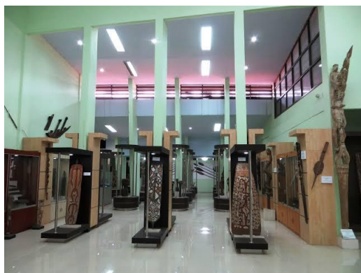
Zaal in het Museum Loka Budaya