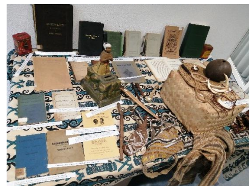
Een kleine expositie met o.a. artefacten van zending Van Hasselt

Het werd een boeiende discussie waarbij vastgesteld werd dat er in Papua zelf vaak met groot respect naar de inspanningen van zendelingen en hun vrijgekochte helpers wordt gekeken.