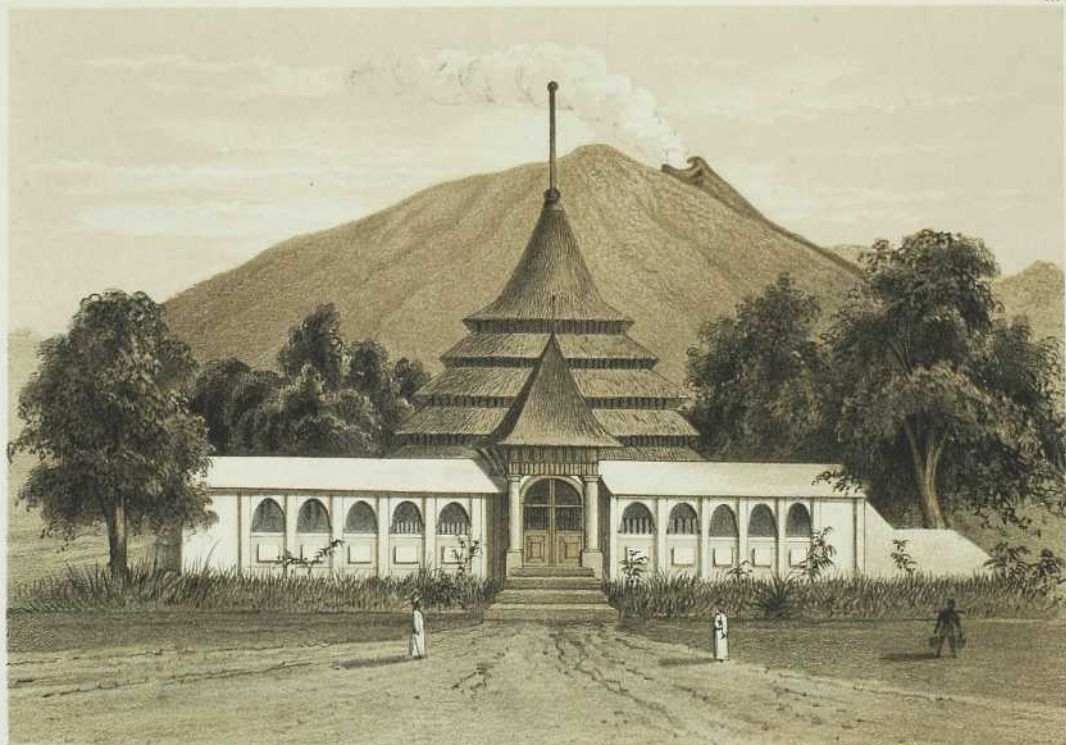
GROOTE MÉSIGIT TE TERSATE.