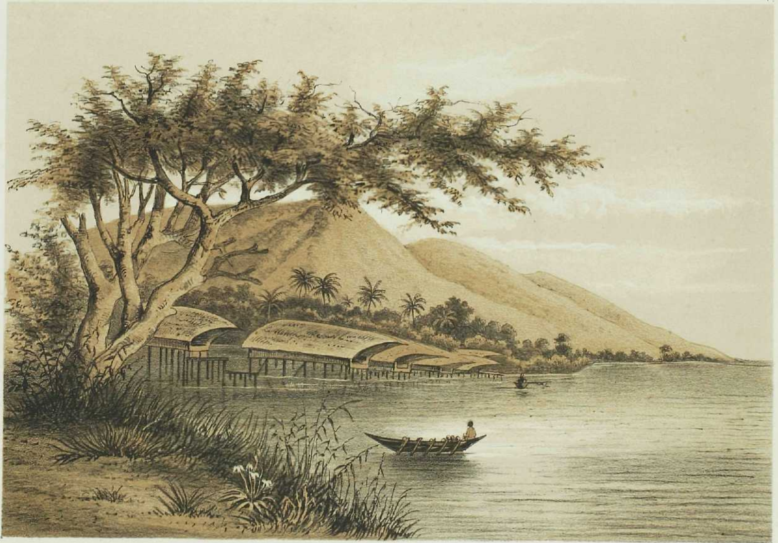
HET DORP WAREFONDI OP SOËK.