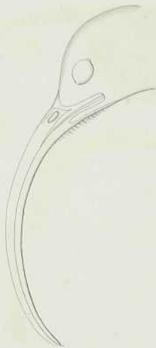
KOP VAN DEN EPIMACHUS VETUID ♀ v. R. (Epimachus Albertisi.)