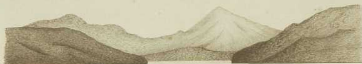
DE KAWUWI-BAM OP MEESNOEM DRIE MIJL UIT DEN WAL VAN N.O. GEZIEH.