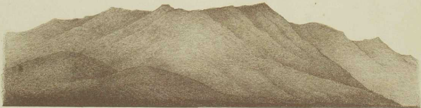
DE BERG SEBELA VAN DE REEDE VAN BATJAN GEZIEN.