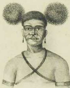
BEWONERS VAN ANDAL