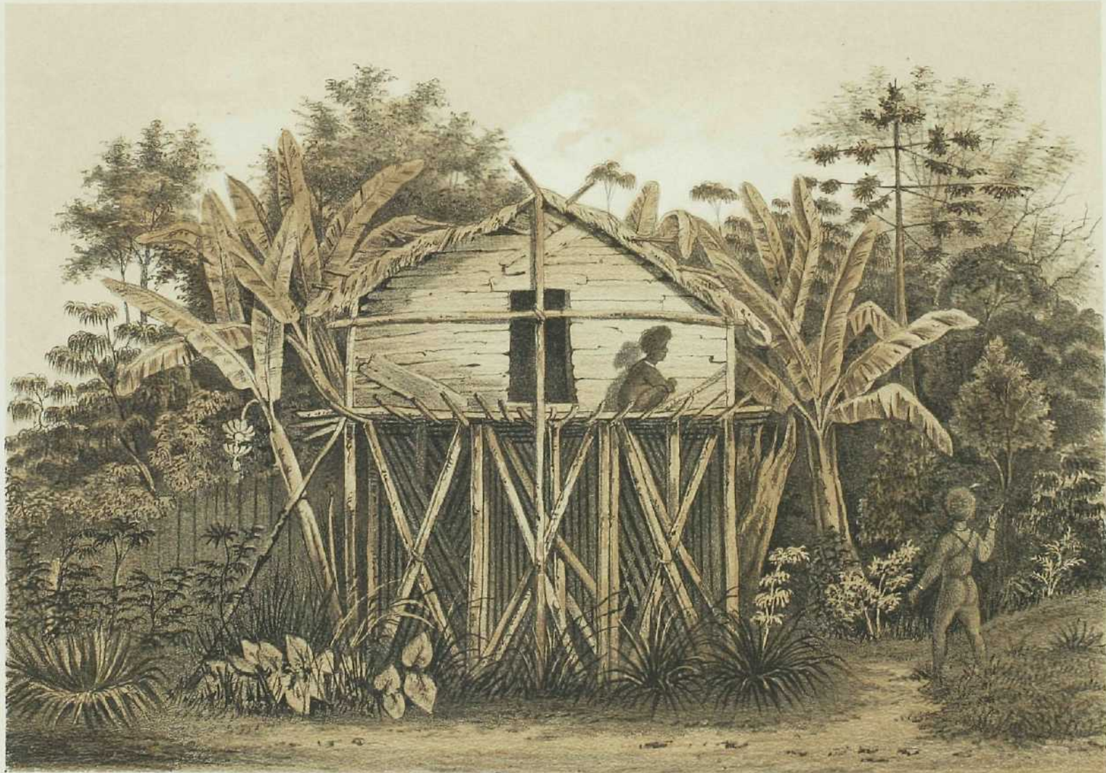
ARFAKSCH HUIS TE ANDAI.