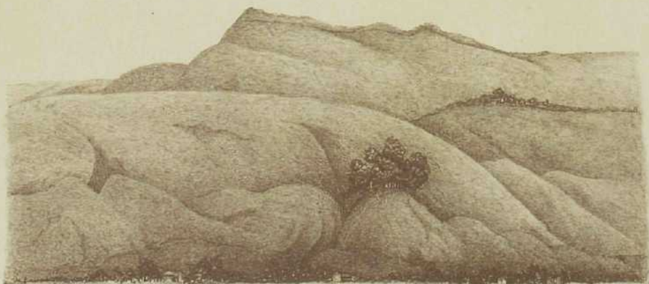
DE BERG AROEAI IN DE BAAI VAN ANSOES UIT HET ZUIDEN GEZIEN.