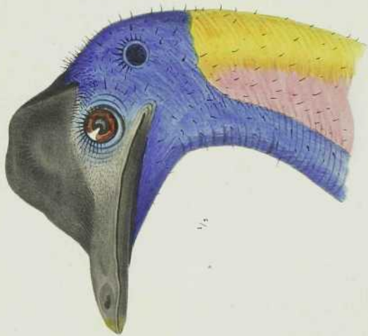
KOP VAN DEN CASUARIBUS PAPERANUS.