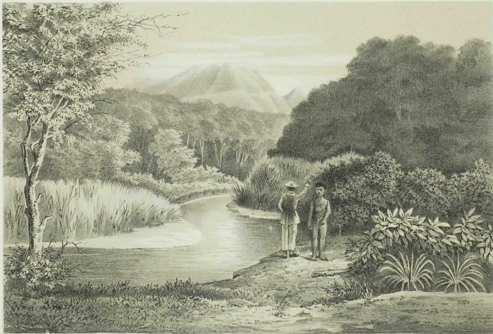
DE RIVIER VAN ANDAI VOORBIJ HET ZENDELINGSHUIS MET DEN ARAFAK IN HET VERSCHIJT.