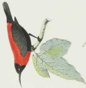
1. PACHYCEPHALA SCHLEGELII.