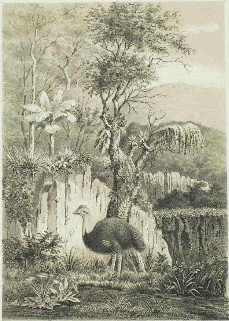
KAZUARIS IN HET BOSCH.