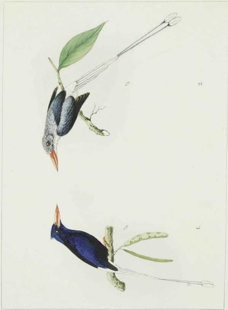
1. TANYSIPTERA CAROLINE \sigma v. R.