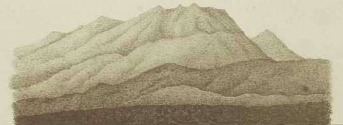
DE TOP VAN DEN AREAK VAN DES MOND DER ANDAM-RIVIER GEZIEH.