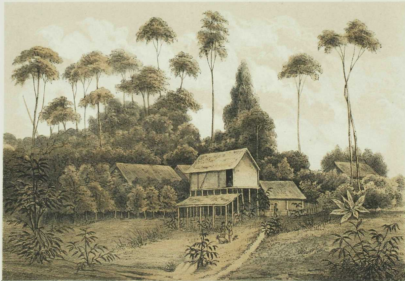
HET DORP ROEMSARO OP MEFOOR.