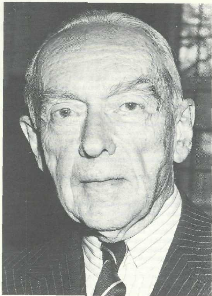
Dr. J. H. van Roijen (geb. 1905) was in 1945 en 1946 eerst minister zonder portefeuille en later minister van Buitenlandse Zaken in het kabinet Schermerhorn. Van 1947 tot 1950 was Van Roijen Nederlands ambassadeur in Canada en van 1950 tot 1964 Nederlands ambassadeur in de Verenigde Staten.