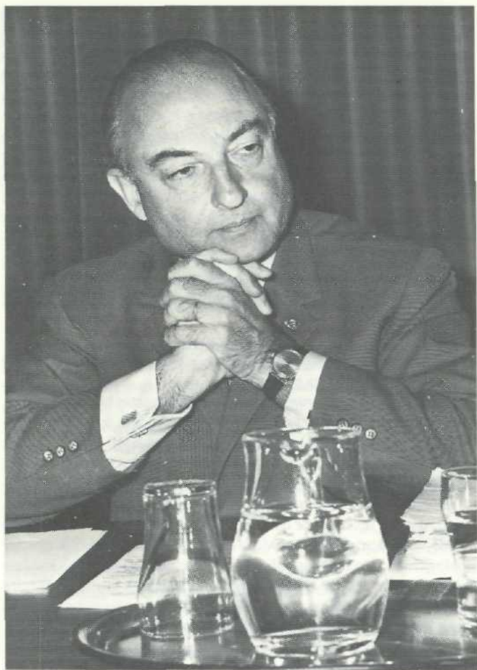
Drs. W. K. N. Schmelzer (geb. 1921) was staatssecretaris voor Algemene Zaken in het kabinet De Quay (19 mei 1959 tot 24 juli 1963) en als zodanig de rechterhand van premier De Quay.