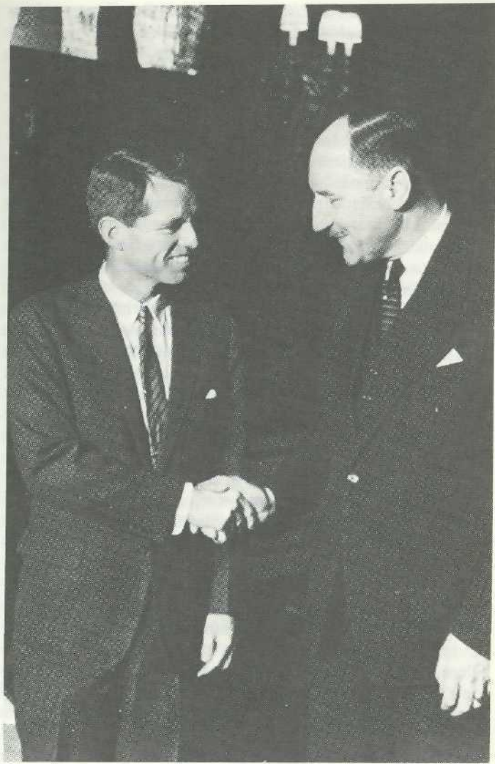
Op maandagmorgen 26 februari 1962 spreekt mr. Luns uitvoerig over Nieuw Guinea met de Amerikaanse minister van Justitie, Robert Kennedy. Luns is bepaald niet tevreden.