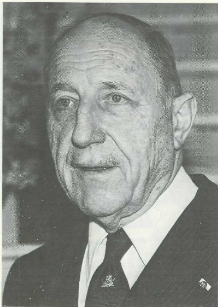
Mr. dr. J. M. A. H. Luns (geb. 1911) was van 1952 tot 1971 bijna negentien jaar lang minister van Buitenlandse Zaken in acht opeenvolgende kabinetten.