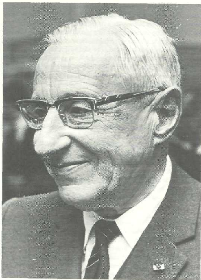
Prof. dr. J.E. de Quay (geb. 1901) was minister-president van een kabinet dat was gebaseerd op een coalitie van KVP, VVD, ARP en CHU, dat van 19 mei 1959 tot 24 juli 1963 in functie is geweest.