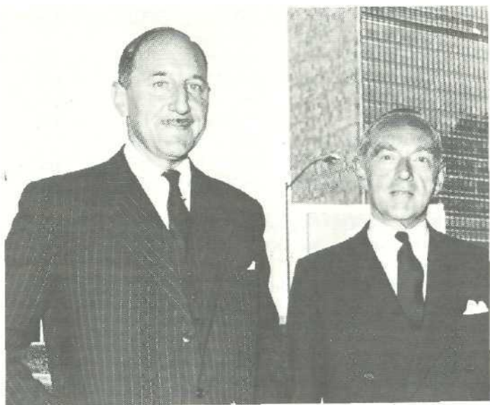
Links minister van Buitenlandse Zaken mr. Joseph Luns; rechts ambassadeur dr. Herman van Roijen